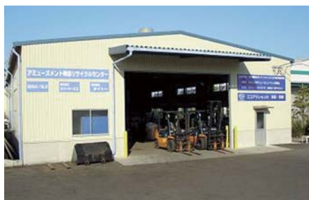
使用済みアミューズメントマシン 分離・解体倉庫