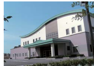
汚泥再生処理センターの建設例 (大牟田市東部環境センター)