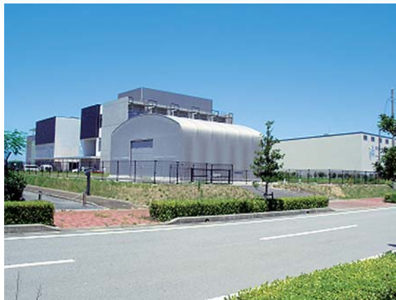
技術研究所実証フィールド