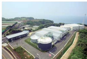
地域バイオマス利活用施設の建設例 (MKE BIMAステーション三浦)