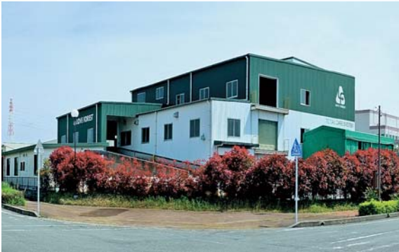
ラブフォレスト大牟田