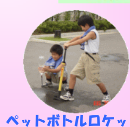
ペットボトルロケット うまく飛ばかな・・・