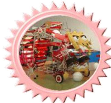
有明工業高等専門学校制作ロボット

また、国立有明工業高等専門学校のみなさんによるロボット操作実演・体験なども催し、多くの来場者で賑わいました。