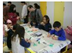
オリジナルのキーホルダー作り