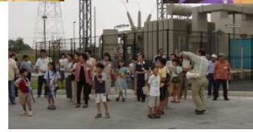
RDF 発電所の見学風景