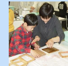
牛乳パックでハガキを作りました。