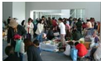
フリーマーケット風景